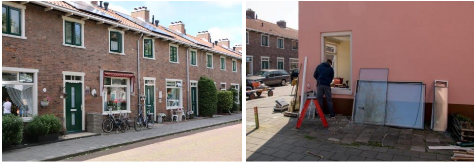
Werkzaamheden in de Melklaan e.o. te Velsen-Noord